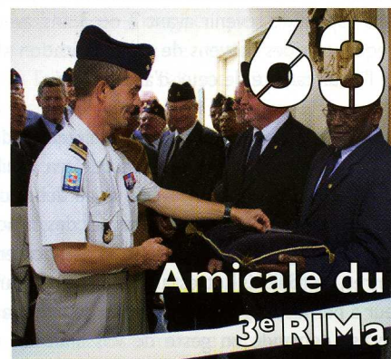
Amicale du 3 e RIMa

Vous venez être muté au PAM 2012. Signalez votre changement d'adresse auprès du Service Abonnements de L'AOB.