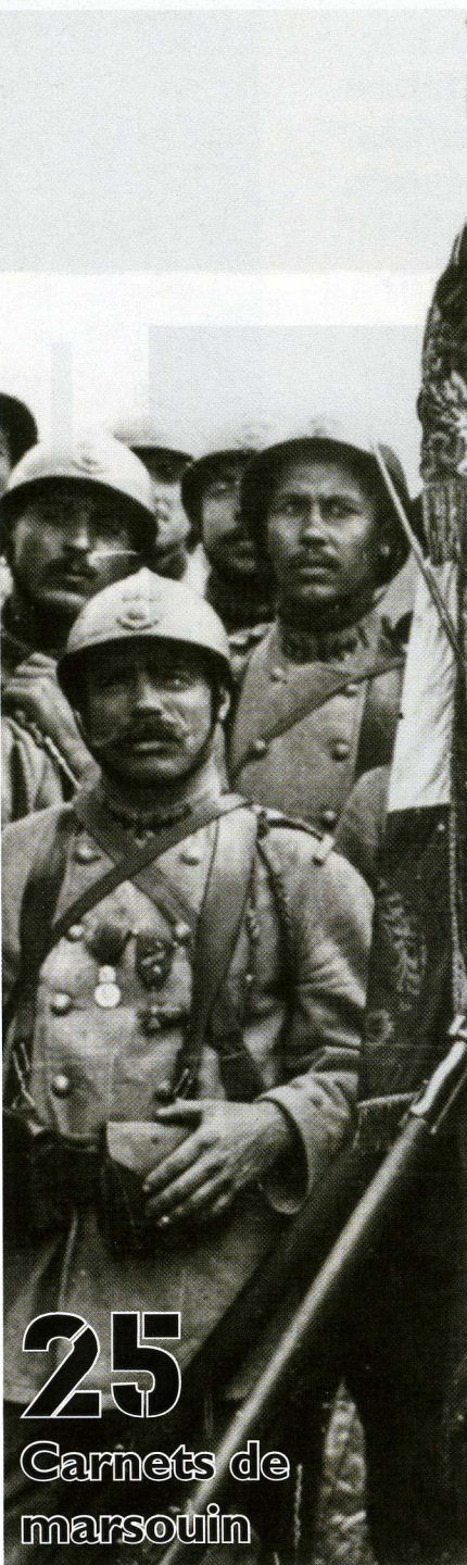
Carnets de marsouin

Par courrier postal : L'Ancre d'Or-Bazeilles Caserne Guynemer 2, rue Charles-Axel Guillaumot 92500 RUEIL-MALMAISON