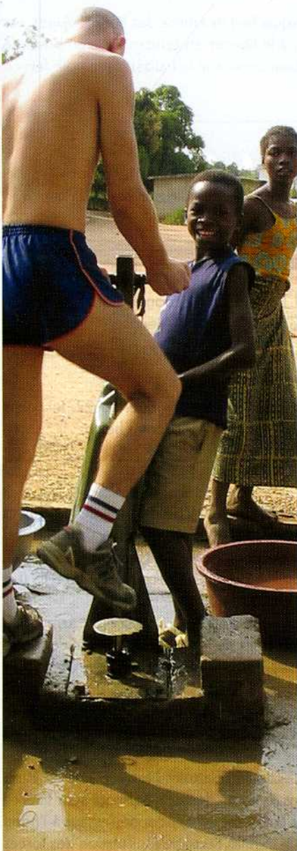
Couverture : 14-juillet 2014