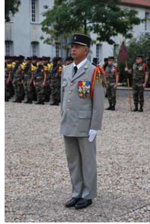
ADC NIAS 40 ANS DE SERVICE