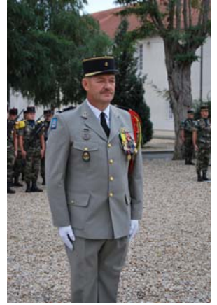
MJR FORFERT 32 ANS DE SERVICE