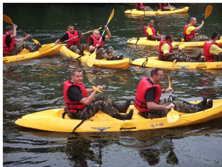
Adj Mathé et Cch Dec au Challenge canoé