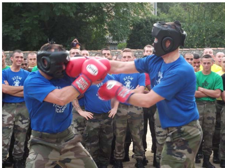
Challenge de boxe