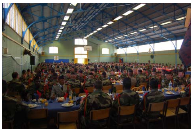
Repas de corps