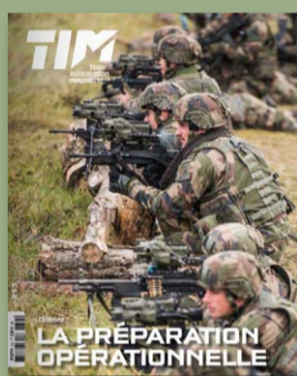
Terre Info Magazine